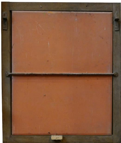
Afbeelding 5. Achterkant van de statie in Olburgen

De eerste kruisweg maakte Schenk op doek en zelfs op zink. Later kreeg hij steeds meer vragen om op paneel te schilderen. In Olburgen heeft hij de staties op eiken houten panelen geschilderd. Aan de achterkant is een stalen staaf bevestigd om kromtrekken van de panelen te voorkomen.