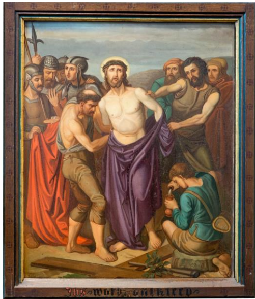
Afbeelding 4a. Een statie van Schenk in de St. Willibrorduskerk op Olburgen

Het is goed te zien dat Schenk die als voorbeeld heeft gebruikt. De houdingen van de afgebeelde personen zijn bijna identiek zoals ook de compositie. De kleurstelling daarentegen verschilt. Op beide staties wordt aandacht geschonken aan de gezichtsuitdrukking van de personen.