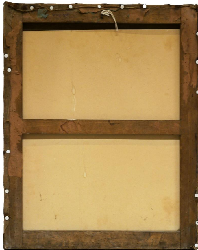
Afbeelding 2. Achterkant van het portret

Het is daarom ook niet duidelijk waarom Kerkhof is geportretteerd. Meestal werd een portret van iemand gemaakt bij een speciale gelegenheid zoals een jubileum. Misschien heeft hij voor Schenk geposeerd nadat hij tot priester was gewijd, wat natuurlijk een speciale en bijzondere gelegenheid was. De familie heeft de waarde van het portret gezien door het niet te vernietigen maar het te bewaren en uiteindelijk te schenken.