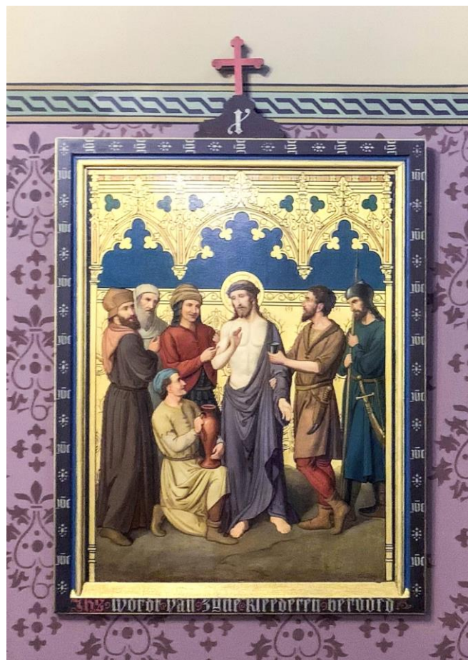
Afbeelding 8. Een statie in de St. Willibrorduskerk in Vierakker