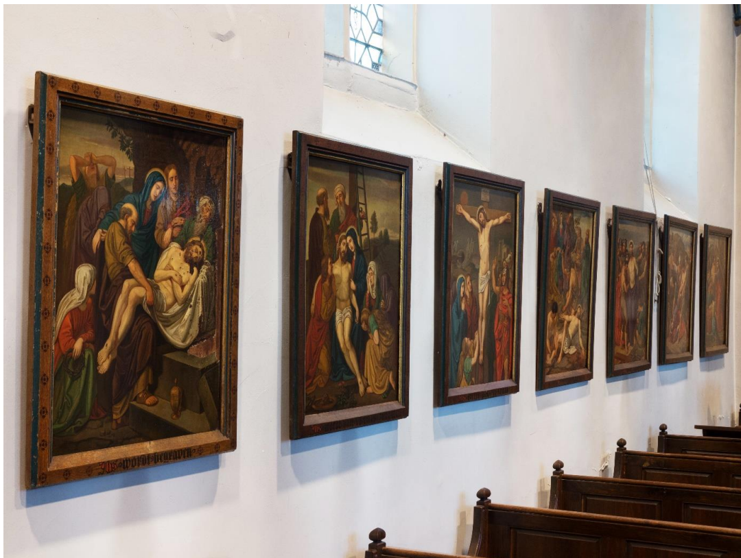
Afbeelding 7. Kruiswegstaties in de St. Willibrorduskerk op Olburgen