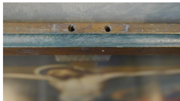
Afbeelding 6. Bovenkant van de lijst (foto: Gosselink-Ramos)