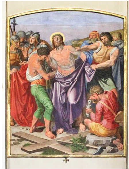
Afbeelding 4b. Een statie van Joseph Führlich in de Nepomuk Kirche in Wenen

De staties in Olburgen heeft Schenk in Brussel geschilderd en gesigneerd.