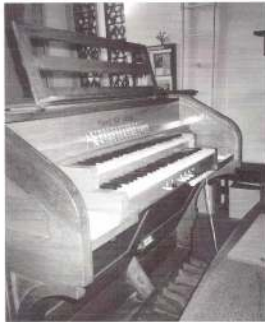
De speeltafel (klavieren) van het orgel in Olburgen

Het meest voor de hand liggende is dat Vermeulen het oude orgeltje heeft afgebroken en er een nieuw voor in de plaats heeft gezet, met gebruikmaking van oud pijpwerk, iets wat deze orgelbouwer wel vaker deed. Als dat zo zou zijn, zou het oude pijpwerk wel eens historisch materiaal kunnen zijn uit