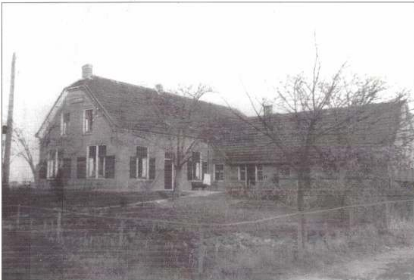
De boerderij Steenderdiek aan de Dr. A. Ariënsstraat. Zeer velen zullen dit plaatje herkennen

PERIODIEK ORGAAN VAN DE HISTORISCHE VERENIGING STEENDEREN