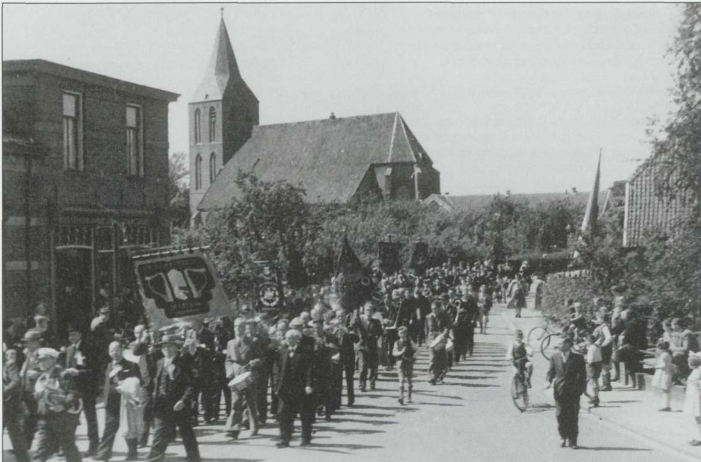
Harmoniekorpsen in de Burgemeester Smitstraat in Steenderen op 7 juni 1949, het officiële begin van de dichting van de Baakse Overlaat. DSS (Door Samenwerking Sterk) is juist gepasseerd. Daarachter loopt St. Caecilia, eveneens uit Steenderen. Rechts achter de boerderij van H. Donderwinkel, staat een vlag bij het Polderhuis, het kantoor van het Waterschap.