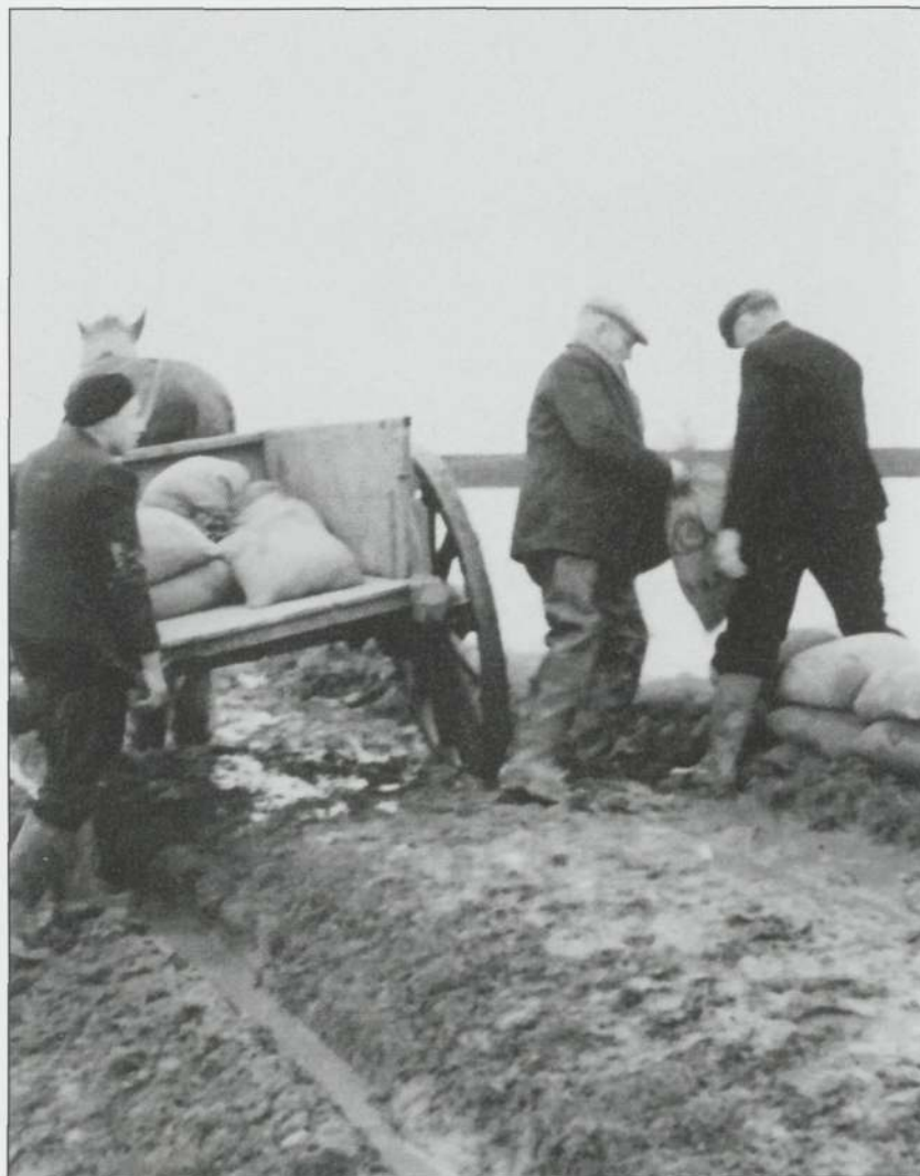
Mensen leggen zandzakken langs de IJssel in de Bakerwaard. Het paard strekt de stootkar tot vlak bij het water.